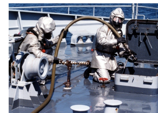
Pompier de la flotte QMF MOPOMPI