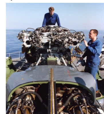
Mécanicien aéronautique : EDM PORTEUR / QMF MAINTAE