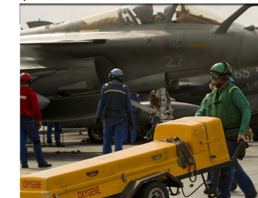
Matelot de piste et pont d'envol QMF MOPONTVOL